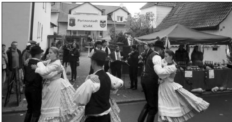
Néptáncosaink műsorait szívesen és nagy tetszéssel fogadták vendéglátóink