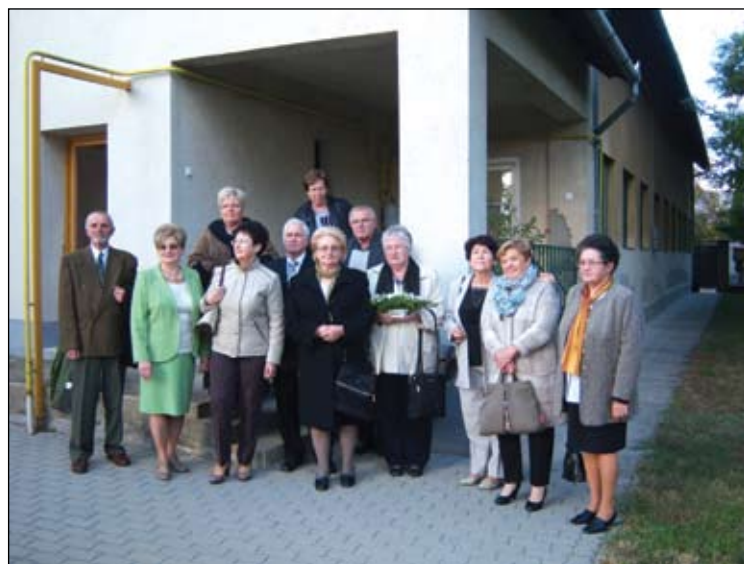
Az egykori osztály tagjai a Kálvin téri épület előtt