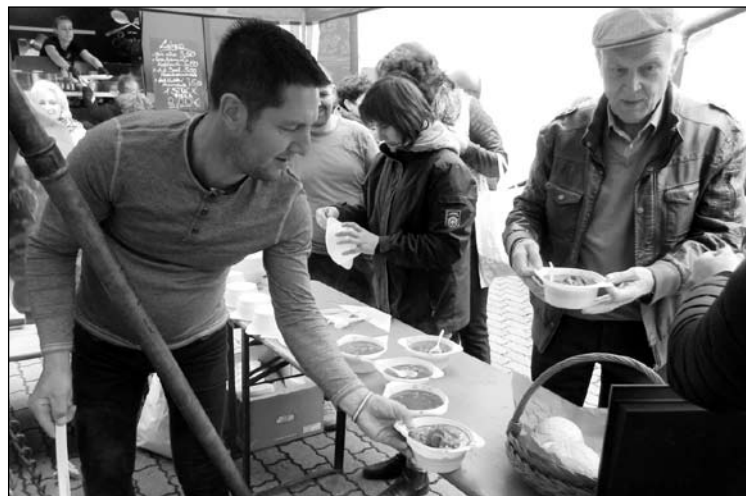
Nagy sikere volt az izsáki gulyásnak

hogy nagyon jól szerepelt az izsáki csapat, melyet bizonyít az is, hogy jövőre új családokat kell keresnünk, akik szívesen fogadnak majd vendégeket Strullendorfból, mivel több új családdal kötöttünk barátságot, akik már jelezték, hogy jövőre szívesen