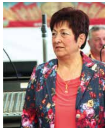
...és a támogató

a főtéren megrendezett tésztafőző versenyre, vagy a bor-utca hangulatára. Mára ezek visszakerültek a Diófás-kertbe, ahol, bár kisebb területen, de nemzetközivé fejlődött ez a nap. Német, olasz ajkú és ízlésű családok, baráti társaságok jönnek ide évről évre egymásért. Vagy talán a fakanálért? – teszem fel a kérdést a rendezvény szervezőjének. – Valóban elindult egy vándor fakanál, melynek nyertesét évről évre szakmailag hozzáértő zsűri ítélte meg, ezidáig. Azonban idén más volt a terv – közli mosolyogva Laci – többet el nem árulva. – Nem biztos, hogy csupán egy nyertesnek kell születnie a nap végére, ehelyett érezze magát mindenki győztesnek, aki itt volt, beletette összes tudását, szeretetét a készített ételbe. TK