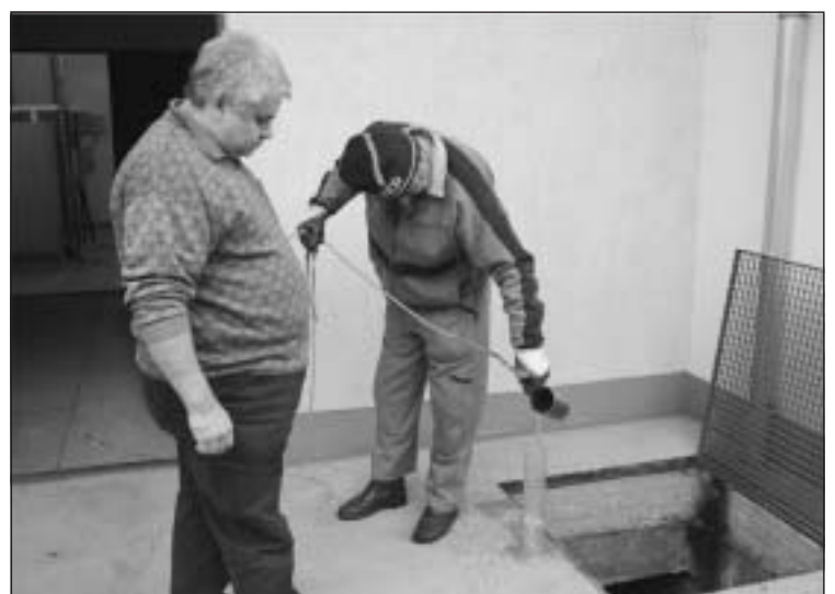
Az ellenőrzések megfelelő eredményt mutatnak

- Valóban nem olyan színű víznek kellene távoznia, mint a bemutatott minta volt, s általában nem is olyan távozik. Néha azonban előfordul, hogy megúszik a lebegő iszap, s kifolyik a tisztított vízzel együtt, és ez okozza a riasztó látványt. Erről az iszapról azonban el kell mondanom, hogy egyrészt semmiféle fertőzésveszélyt nem hordoz, másrészt ittmarad a kifolyónál lévő ülepítőnkben, tehát szó nincs arról, hogy szennyeznék, fertőznék a környezetet. Hatékonyságunkat egyébként rendszeresen ellenőrzik az illetékes hatóságok, s 93-94 százalékos hatásfo-