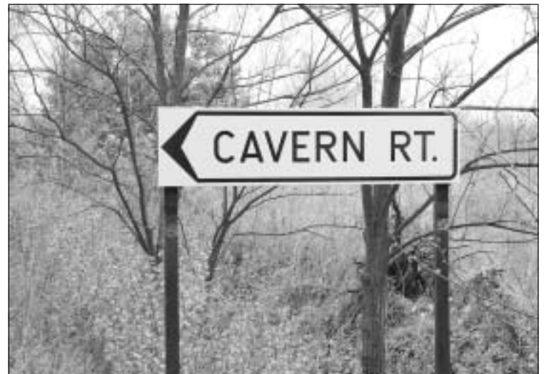
Új név, új útirány?

- Abszolút így van, mi voltunk az egyetlen komoly vetélytársuk az országban. A Walton, melyet 1999 szeptembere óta forgalmazunk, igen sikeres termék. Jellemző, hogy már a bevezetése évében kettő és fél millió palackkal adtuk el belőle. Összehasonlításként; egy-egy induló termékből jó, ha tízezer üveg gazdára talál kezdetben. Hasonlóan jól fogadták a fogyasztók a Voila családot, s egyedüli sikeres hazai gyermekitalként, a Kölyökpezsgőnk is piacvezető termék, de továbbra is keresettek a Caesar és Pompadour. E felsorolás egyébként eladási sorrendet is jelent. A cég erejét mutatja, hogy tavaly például 70 százalékos osztalékot fizettünk részvényeseinknek. Előző években még ennél többet is, de az olcsó import pezsgők behozatala -ahogy valamennyi hazai gyártót- bennünket is kissé