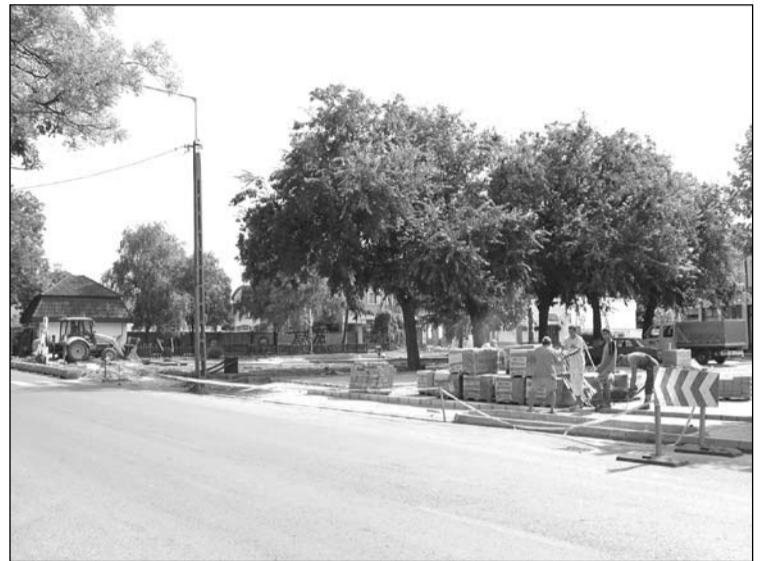
A központi parkoló új burkolatot kap, s a mellette lévő park is megújul, melyet csobogókúttal, padokkal és új növényzettel alakítunk ki

Ezúton fejezem ki köszönetemet a Bocskai és a Szily Kálmán utca lakóinak azért a megértő hozzáállásukért, mellyel az útkorszerűsítésnek áldozatul esett utcai fáikat, növényeiket engedték eltávolítani. És valamenyünk érintett utca lakóinak is köszönöm az építési munkák miatti kényelmetlenségek elviselését, ebben tanúsított