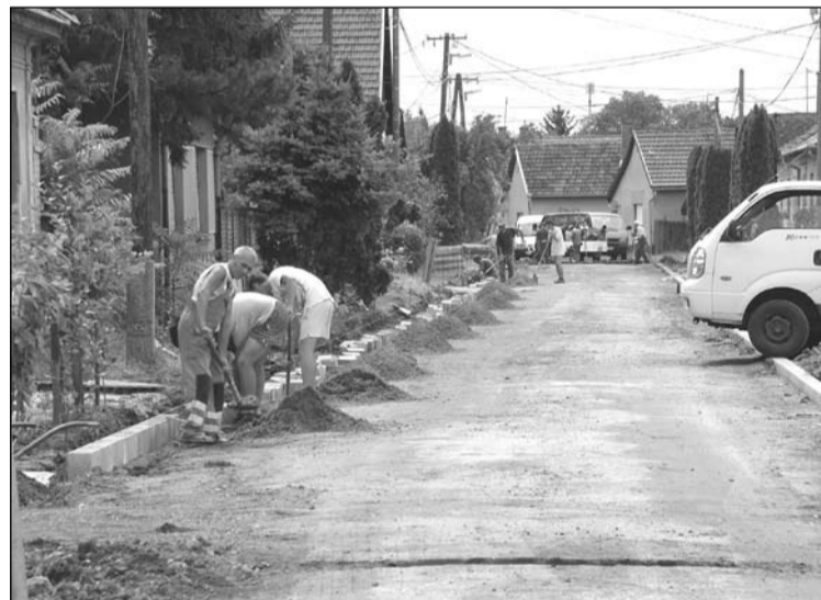
A Bocskai, a Szily Kálmán utcák, valamint a Kodály utca és a Mező utca vasút felőli szakasza kap új burkolatot és szegélyt, utóbbiaknál kulturált parkolók is kiépítésre kerülnek