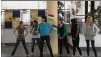
Így táncolnak csárdást a németek