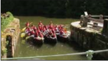
Felejthetetlen élmény volt a kenutúra