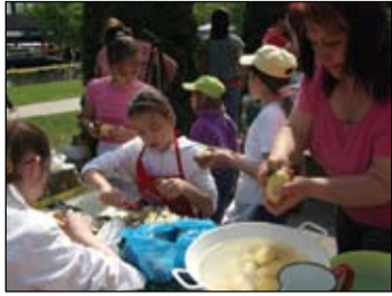
Készül „Nagy lebbence” a Tészta Majálison. Köszönjük Eta nagy és az összes szülő segítségét!