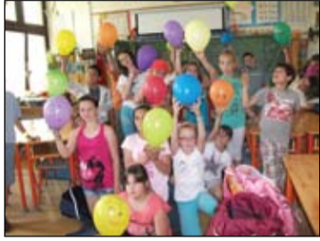
Hurrá, itt a VAKÁCIÓ! Felső tagozatosok leszünk!